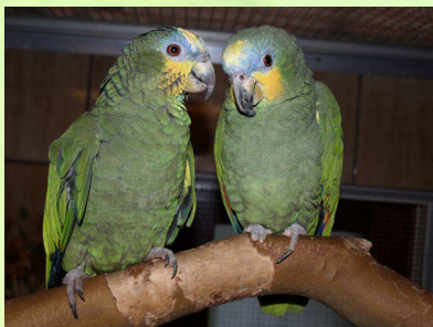
Nico und Juppi